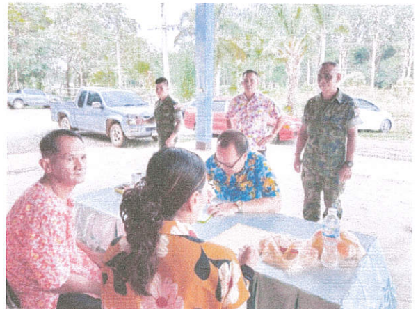
ลงทะเบียน