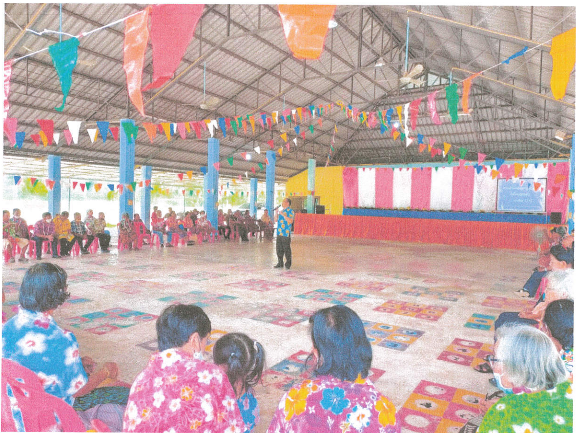
กล่าวเปิดโครงการ