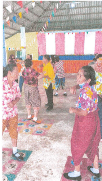
ออกกำลังกาย