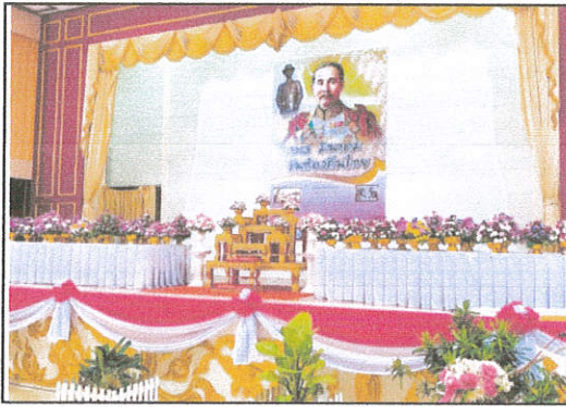
ภาพที่ ๑ พระบรมฉายาลักษณ์