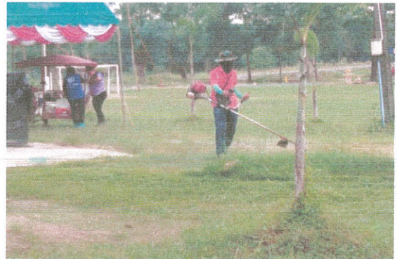
ภาพที่ ๑๖ กิจกรรมตัดหญ้าสวนหย่อม