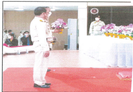
ภาพที่ ๔ ผู้บริหาร อบต.วางพานพุ่มดอกไม้สด