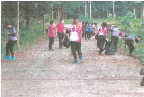
ภาพที่ ๑๕ กิจกรรมเก็บขยะบริเวณไหล่ทาง