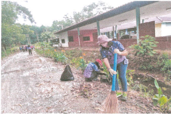
ภาพที่ ๑๓ กิจกรรมปลูกต้นไม้