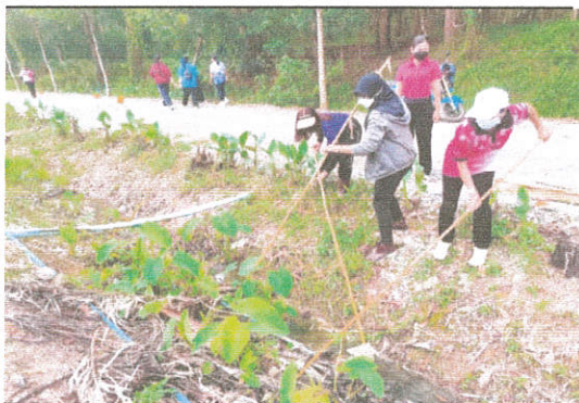
ภาพที่ ๑๑ กิจกรรมการรักษาสีงแวดล้อม