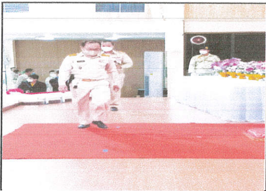
ภาพที่ ๓ ผู้บริหาร อบต.วางพานพุ่มดอกไม้สด