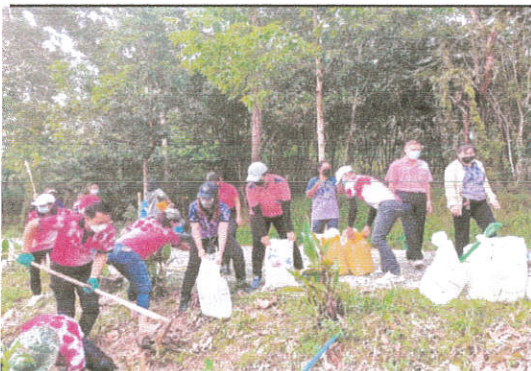
ภาพที่ ๙ กิจกรรมทำฝายน้ำล้นแหล่งเรียนรู้