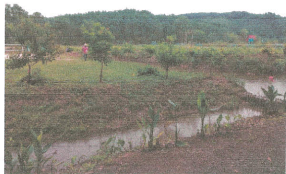
ภาพที่ ๑๒ กิจกรรมการรักษาสีงแวดล้อม