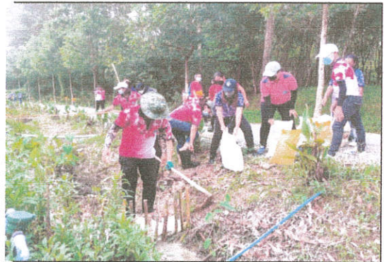
ภาพที่ ๘ กิจกรรมทำฝายน้ำล้นแหล่งเรียนรู้