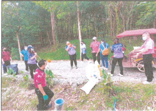
ภาพที่ ๗ กิจกรรมทำฝายน้ำล้นแหล่งเรียนรู้