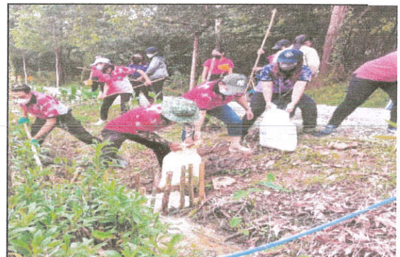
ภาพที่ ๑๐ กิจกรรมทำฝายน้ำล้นแหล่งเรียนรู้