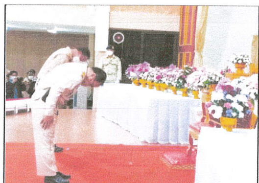
ภาพที่ ๖ ผู้บริหารถวายความพระบรมสาธิสัถักษณ์