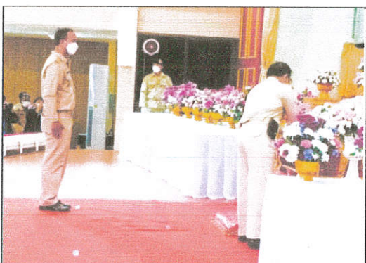
ภาพที่ ๕ ถวายราชสักการะ รัชกาลที่ ๕