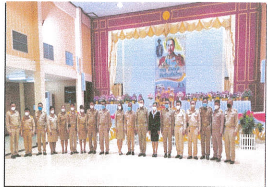
ภาพที่ ๒ ผู้เข้าร่วมกิจกรรมถ่ายรูปร่วมกัน