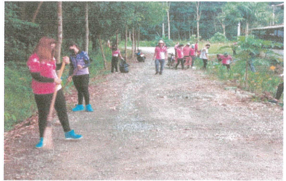
ภาพที่ ๑๔ กิจกรรมทำความสะอาดไหล่ทาง